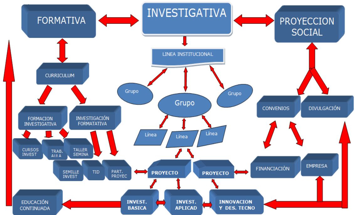
Figura 5.2 Estructura Funcional del SIU

apropiación social del conocimiento lo que conlleva a incrementar el insumo para la formulación de nuevas e innovadoras propuestas de investigación.