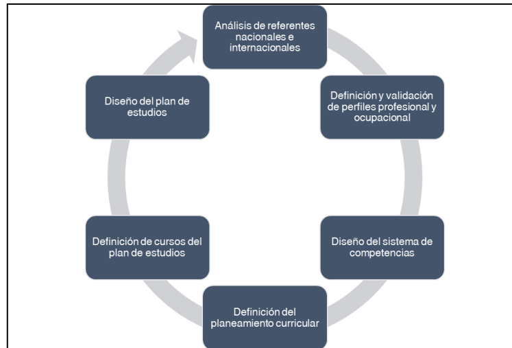
Ilustración 1. Análisis funcional

Nota. Tomado del Procedimiento de gestión del diseño, creación, supresión, renovación o modificación curricular de programas académicos.