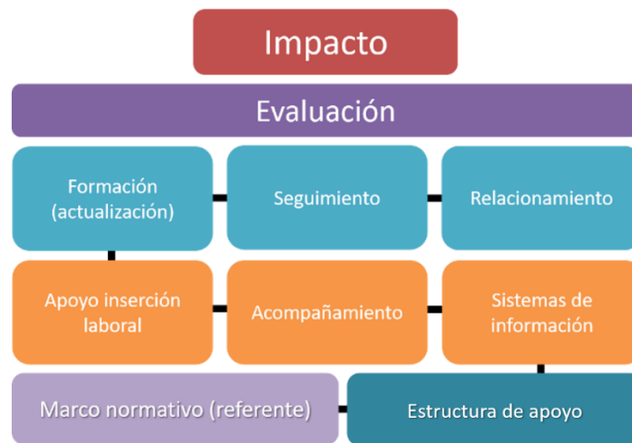
Figura 1 Modelo de egresados

El modelo se desarrolla a partir de los componentes detallados a continuación: