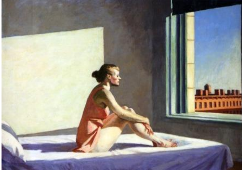
Figura 1. Sol de la Mañana. (Hopper, 1952).